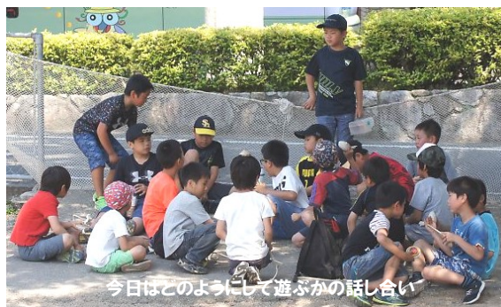
今日はどのようにして遊ぶかの話し合い

青少年アンビシャス運動(福岡県民運動)の事業として2001年に開設しました。今の若者が少年期に異年齢の子どもで社会で遊ぶことがなくなったことにより、自分で切り開く力、コミュニケーション能力などが育まれていないと言われたことから昔はあった地域の子どもの社会を再生させるために開設したものです。県内に約260ヶ所あります。広場は、会員制ではありません。自分が行きたいときだけ参加できる子どもたちの居場所です。幼稚園から6年生まで集まっています。遊びは自由ですが、広場には難しい試験に合格した「和ごまのちびっこ指導員」が約10名います。その子たちを中心に「けんかごまの団体戦」で遊ぶのは恒例になっています。参加は自由です。もちろん和ごまの指導も指導員がしてくれます。ボランティアは見守るだけで子どもたちが勝手に行動しています。社会に出て必要な自立心・社会性・創造力を育んでいます。